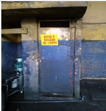
Foto No. 5. Sitio de secado de lodos