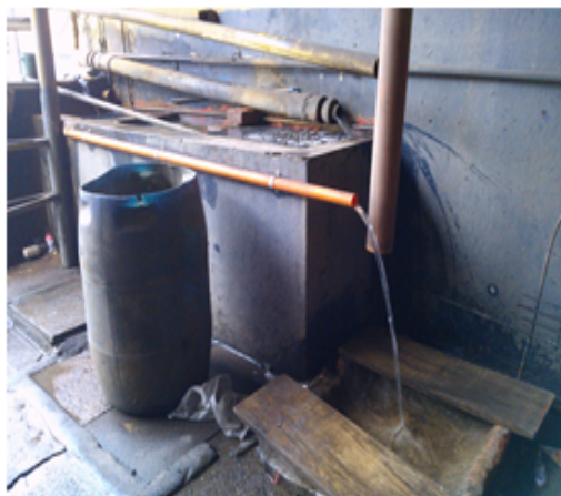
Foto No. 2. Tratamiento y recirculación de agua