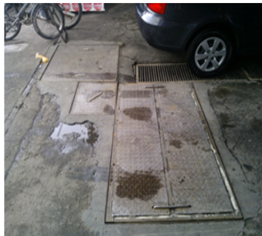
Foto No. 4. Trampa de grasas