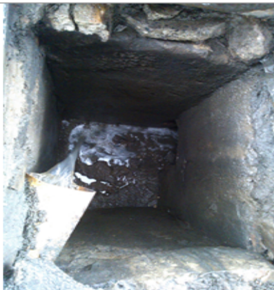
Foto No. 6. Caja de aforo y toma de muestras, externa.