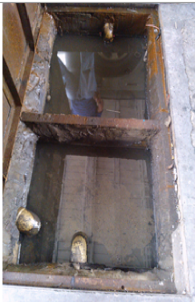
Foto No. 1. Trampa de grasas