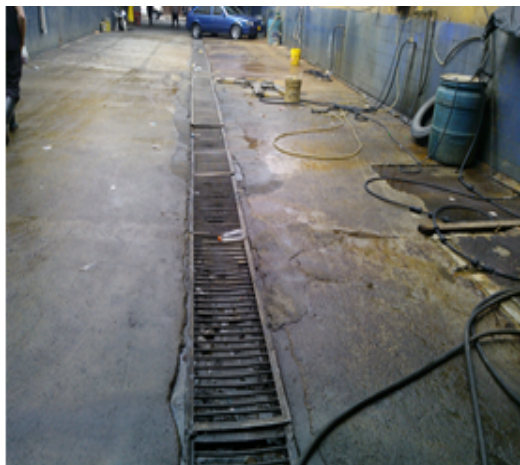
Foto No. 3. Rejillas